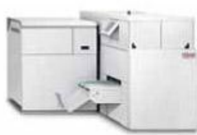
Watkiss PowerSquare 200