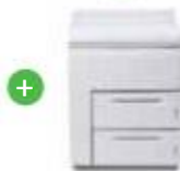
Модуль увеличенной емкости для вставки больших листов