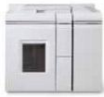
Базовый финишный модуль Direct Connect