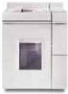
Базовый финишный модуль