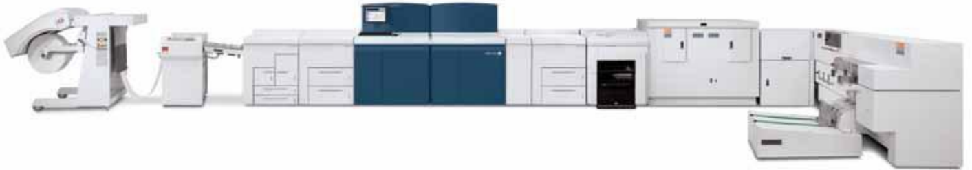
Система промышленной двусторонней печати Xerox Nuvera ® 314 EA с модулем SheetFeeder NV-R от Lasermax Roll Systems, промышленным укладчиком Xerox ® и Xerox ® Book Factory