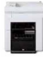
Промышленный укладчик Xerox®