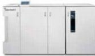
Дырокол GBC Fusion Punch II со сдвижным укладчиком