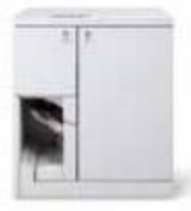
Устройство переплета Xerox® Tape Binder