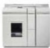
Базовый финишный модуль Plus 2