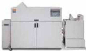
Брошюровщик C.P. Bourg BDFNx с функцией Square Edge