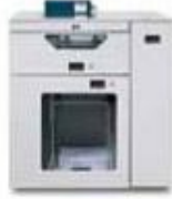
Податчик C.P. Bourg BSFx с поддержкой двух режимов работы