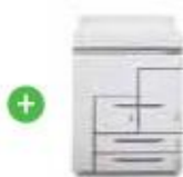
Стандартный модуль вставки листов