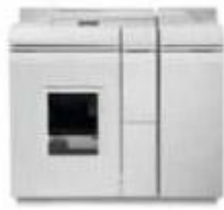
Базовый финишный модуль Plus