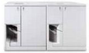
Сдвоенные устройства переплета Xerox® Tape Binders