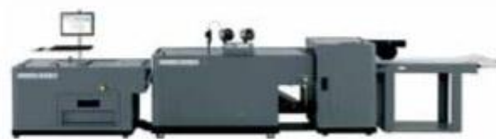
Встроенный брошюровщик Duplo DBM-5001