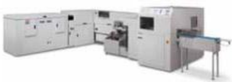
Xerox® Book Factory